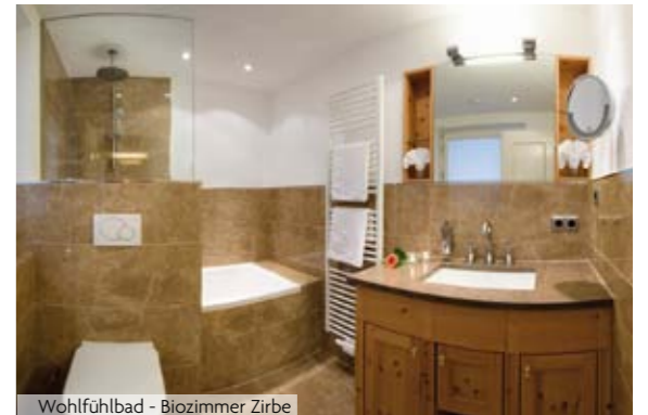
Wohlfühlbad - Biozimmer Zirbe